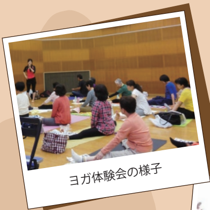
ヨガ体験会の様子

カラダを動かすと心も動く。心が動くと脳が活性化する!? ヨガによる心身の健康効果について楽しくレクチャー