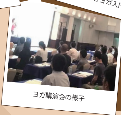
ヨガ講演会の様子