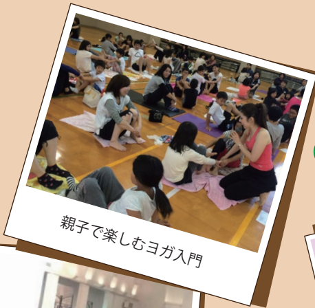
親子で楽しむヨガ入門